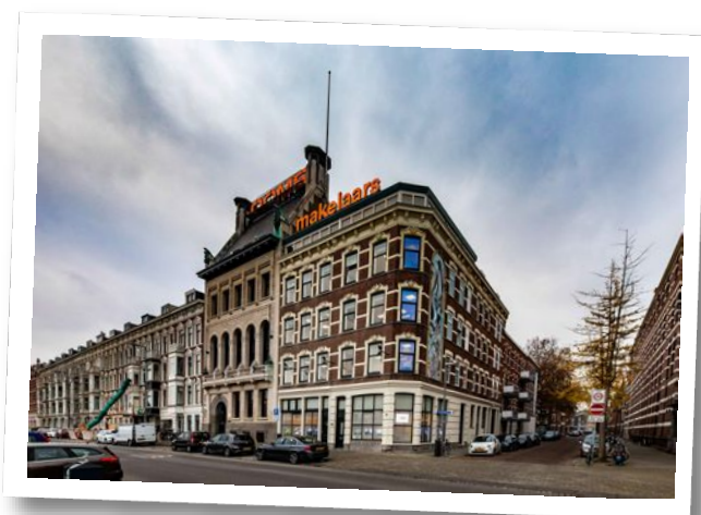
Maaskade 113, 3071 NJ Rotterdam

Informatie aanvragen of bezichtiging plannen? Bel: 010 - 424 8 888