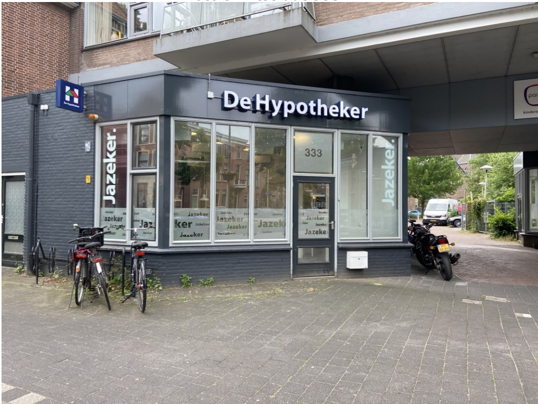
Foto's Biltstraat 333-1