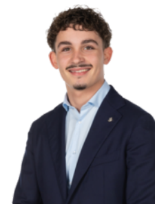
Milan> van Vliet>

NVM Makelaar-Taxateur 06 19 07 75 61 fjhordijk@vanherk.nl